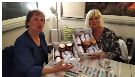
table où se trouvaient 7 jeunes italiens très animés et discutant politique et ... sitcoms ! La soirée s'est terminée par des cadeaux nous a offerts (produits locaux ...) et un tableau illustrant les 20 ans de jumelage que le comité de jumelage a offert à notre comité. À noter que nous avons apporté 12 bouteilles de pétillant et des gâteaux de Lailly-en-Val qui seront partagés par les Pandinesi lors de leurs réunions ou assemblée générale.

Répartis par table de 8, la conversation était fort animée, particulièrement à ma